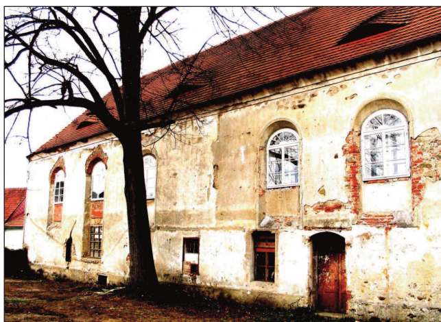
Čkyňská synagoga se brzy promění